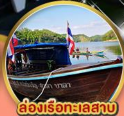
ล่องเรือทะเลสาบฮาลาบาลา

สกายวอล์คชมทะเลหมอกอัยเยอร์เวง บ้านขุนพิทักษ์รายา แม่ลิ่มกอเหนี่ยว ทะเลสาบฮาลาบาลา เกาะกวด สตรีทอาร์ตเบตง ตูโปรงนิยโบราณ อุโมงค์เบตงมงคลฤทธิ์ อุโมงค์ปิยะมิตร ต้นไม้พันปี สวนหมื่นบุปผา น้ำพุร้อนเบตง พิเศษ...เวาถิวเบตง ไก่เบตง เคาหยก กบภูเขาทอด ผักน้ำพืดน้ำมันหอย จมู่มปลาไหลสายน้ำไหล