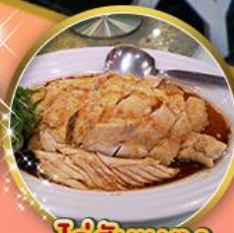
ไก่สับเบตง