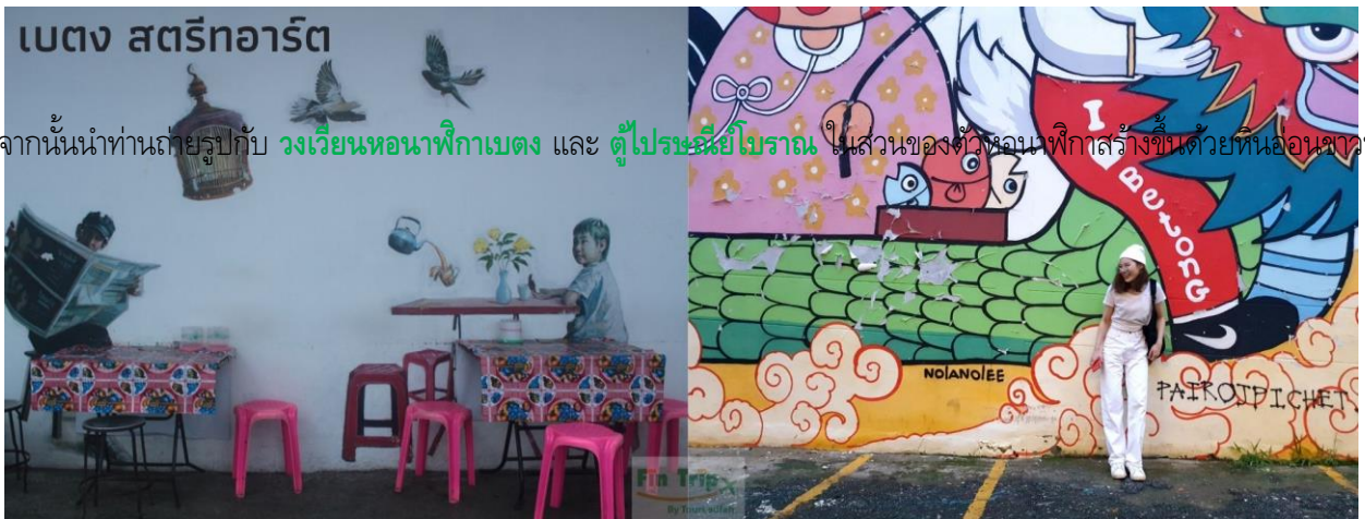
จากนั้นนำท่านถ่ายรูปกับ วงเวียนหอนาฬิกาเบตง และ ตู้ไปรษณีย์โบราณ ในสวนของตัวหอนาฬิกาสร้างขึ้นด้วยหินอ่อนขาวที่มีอยู่มา

จากนั้นนำคณะเดินชมจุดเด่นที่ได้รับความนิยมของตัวเมืองเบตงได้แก่ สตรีทอาร์ท หรือ ถนนศิลปะ งานศิลปะที่สะท้อนเรื่องราวและวิถีชีวิตของความเป็นเบตงได้อย่างดี จุดเริ่มต้นของการสร้างสรรค์ผลงานที่งดงามดังกล่าว เกิดจากทาง อ.เบตง จ.ยะลา ได้มีการจัดงาน 111 ปี เล่าขานตำนานเมืองเบตง ซึ่งมีจุดประสงค์เพื่อสร้างหมุดหมายที่แสดงออกถึงวิถีชีวิตของชาวเบตงและ สร้างจุดดึงดูดนักท่องเที่ยวทั้งชาวไทยและชาวต่างชาติ